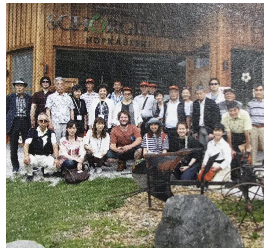
株式会社オールインワン

30回以上の実績があるオールインワンの海外研修(アメリカ、ヨーロッパ)。業界トップクラスの技術や経営、牛肉、牛乳、乳製品の製造・販売の実情を現地視察しています。