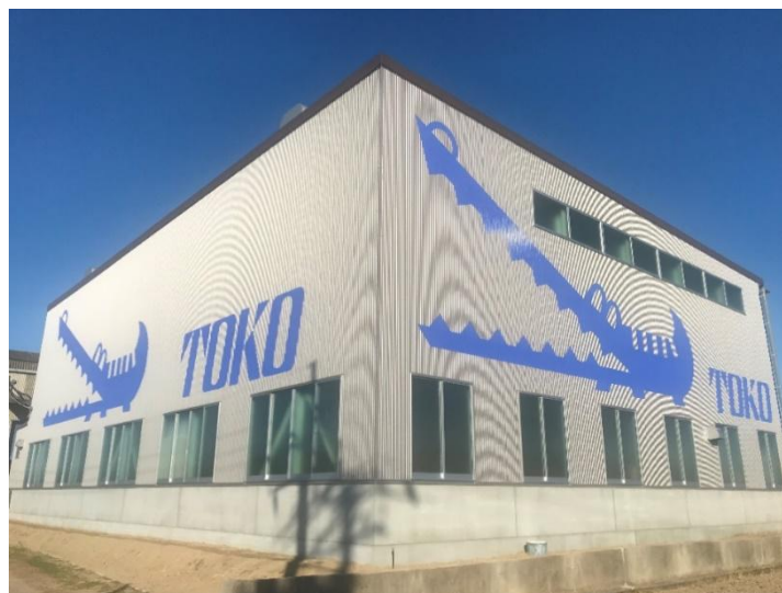
株式会社トーコー